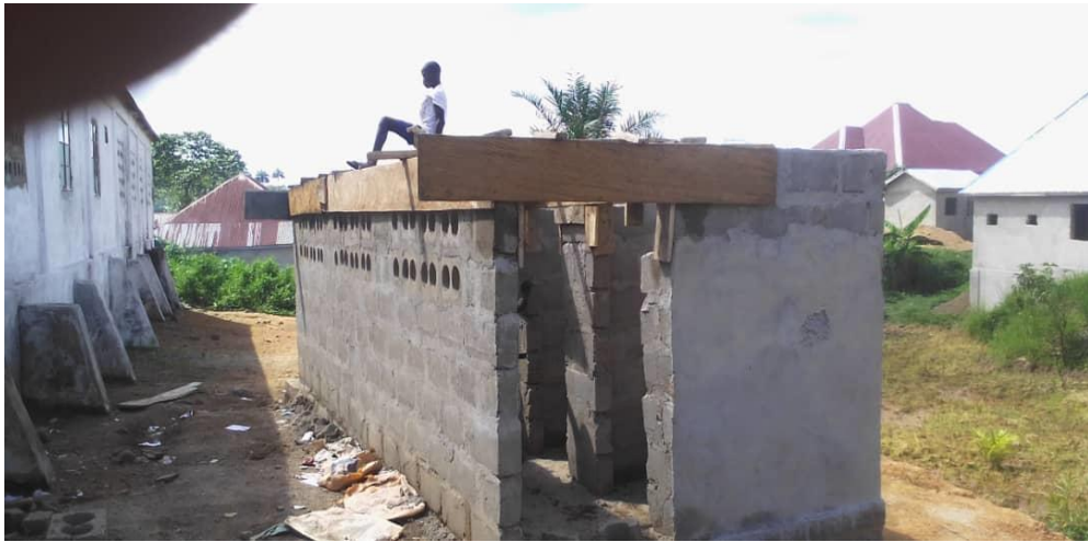
Die Wände des neuen Toilettengebäudes sind gemauert und das Dach ist in Arbeit