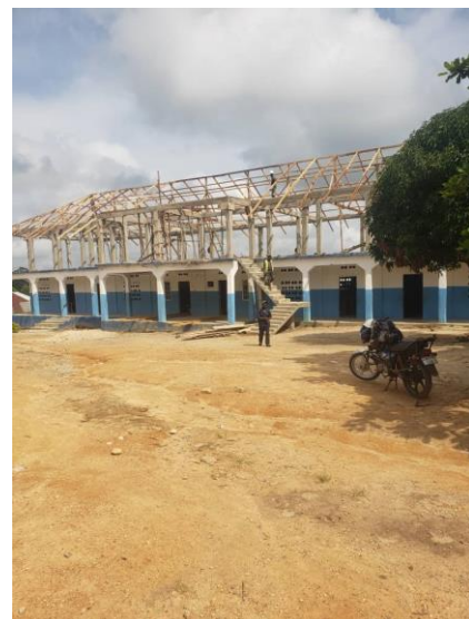
Stand der Arbeiten Anfang November 2023