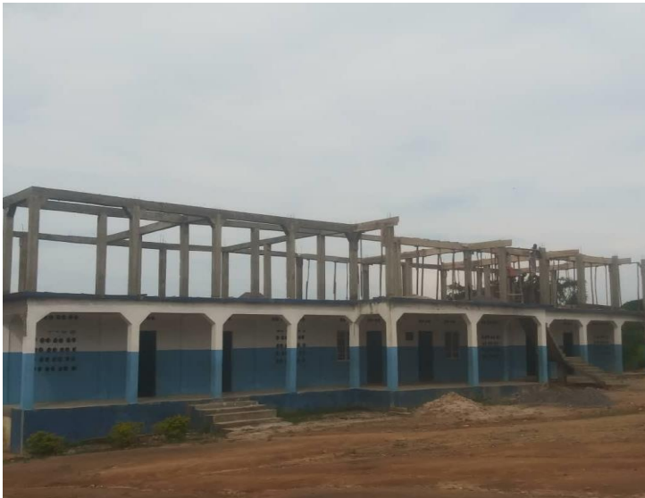
Aufbau der Dachunterkonstruktion

Arbeiten am Dach des Ranendra Datta Buildings / Bau der Treppe und Aufstellen von Betonpfeilern zum Bau eines neuen Dachstuhls.